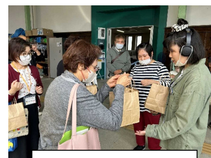
枚方市民生委員視察