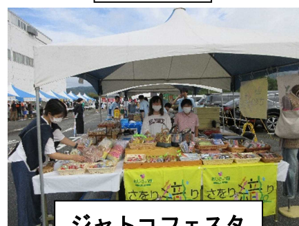
ジャトコフェスタ