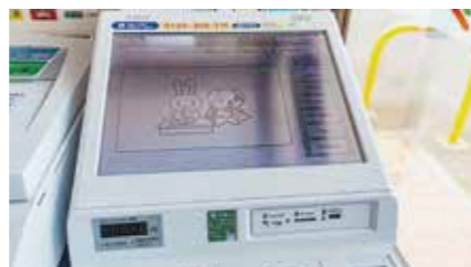
マイナンバーカード使用端末

「電子署名等に係る地方公共団体情報システム機構の認証業務に関する法律」の改正で、電子証明書のスマートフォンへの搭載が可能となったことに伴い、市印鑑条例の一部が改正されます。スマートフォンを使ってコンビニ等で印鑑証明書が取得できます。