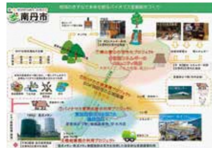
南丹市バイオマス都市構想