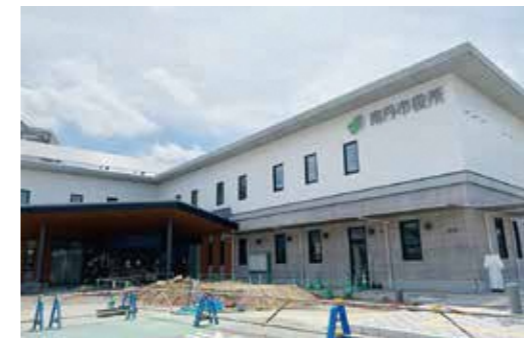
備品発注も済み、開庁が近い新庁舎

A 新庁舎に設置する事務機、キャビネットは、建築と一体的であり、建築意匠などとの関連性も高いことから、メーカー品指定での発注とした。また、大量の品数であり、確実な納入を図るため、直接メーカーからの調達とした。