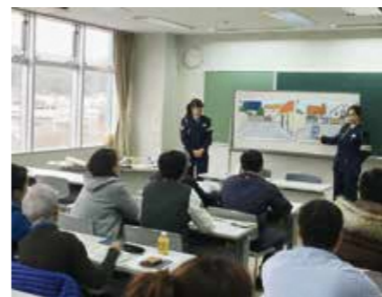
外国人を対象にした交通安全教室