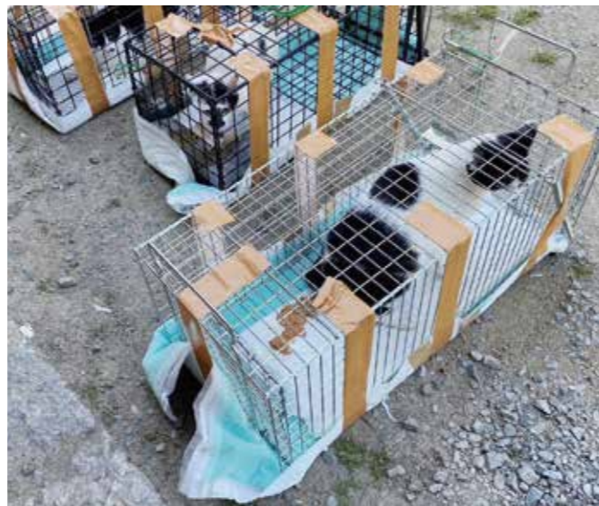
手術を終え元の場所に戻す