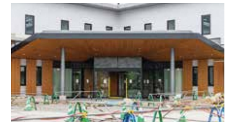
完成が近い新庁舎

新庁舎の事務机、文書保管キャビネット合わせて751台を購入する契約を承認しました。契約金額は3342万9千円。契約の相手は、コクヨマーケティング株式会社関西支社です。