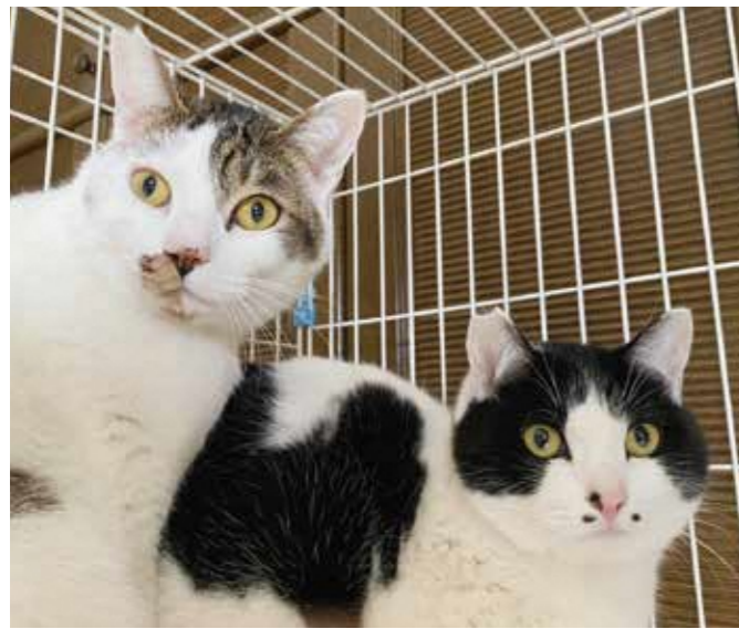
耳カットは不妊・去勢済み

動物愛護の活動は、協働と継続が大切です。活動を知ってもらうには共に活動し、発信をしていくことが大切であり、猫にも人にもやさしい社会を目指して一過性な取り組みではなく、継続性のある取り組みをしてもらいたいと思います。また、本市内での保護猫の譲渡会もしたいと思っています。会場の提供やイベント支援なども考えていただき、末永く続く「にゃんたん市プロジェクト」であってほしいです。