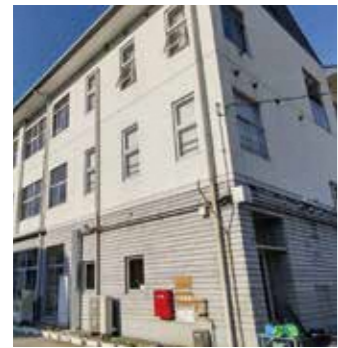
「園部こすもす」が開設されている園部第二小校舎