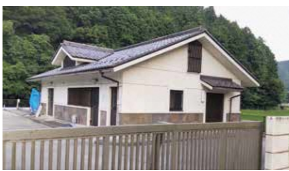
志和賀農業集落排水施設