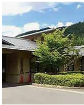
医療スタッフ確保が課題の南丹みやま診療所

Q 突然、みやま診療所の医師が辞職すると発表された。新聞記事では、辞職を決めた主な原因は入院病床を再開しない市の姿勢にあると報道されたが、辞職に至った原因や経緯は。 A 入院病床を復活させると約束がなければ6月末をもって辞めると4月28日に言われた。いろいろ聞くと、次の赴任先より7月から来て欲しいとのことであつた。既に派遣元の京都中部総合医療センターに退職願が出されている。 Q 労働負担の重さと給与が釣り合っていないことも一因であると報告している。