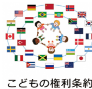
こどもの権利条約

Q 本市は子どもの権利を実現するための措置を講じているか。 A 教育活動全体を通じて一人一人を大切にしながら教育の推進に取り組んでいる。厳しい状況に置かれた子どもがいることや、さまざまな社会的要因を踏まえて、負の連鎖を断ち切るよう取り組んでいく。 Q 本市は子どもの最善の利益を確保するためのどのような措置を講じているか。 A 教育現場における子どもの最善の利益とは、学びの保障や多様な学習機会の確保だと考える。民間のフリースクールとも学校や教