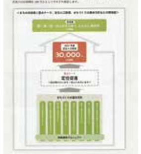
総合振興計画の枠組み

Q 2018年から始まった総合振興計画の中間点で、人口・フレームと土地利用構想をどう評価するか。 A 人口は、計画の想定よりも早く減少が進んでいる。転出の抑制と転入の促進、出生率の向上、健康寿命の延長が必要である。 土地利用構想では、拠点となるところがいくつもあつた。美山文化村、日吉ダム周辺、入り深しなど拠点として力をつけていく。市街地ゾーンでも、周辺の自然と歴史遺産を活用して、新たな整備なども進めていく。 7年度までの中期財