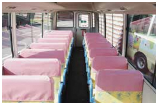
置き去り防止装置が付く送迎バス

A 本市から託児スタッフの人員費、物品購入費、事務費等を支援する。スタッフは合計7人で常時2名体制を取り、託児時間は午後4時半から7時までとなっている。最大で7人の児童が利用されている。