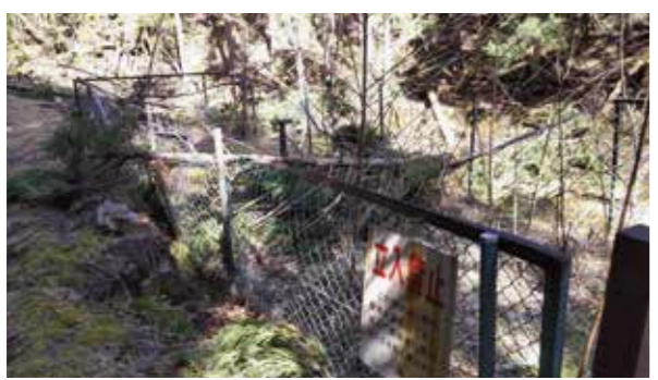
倒木で壊れたフェンス