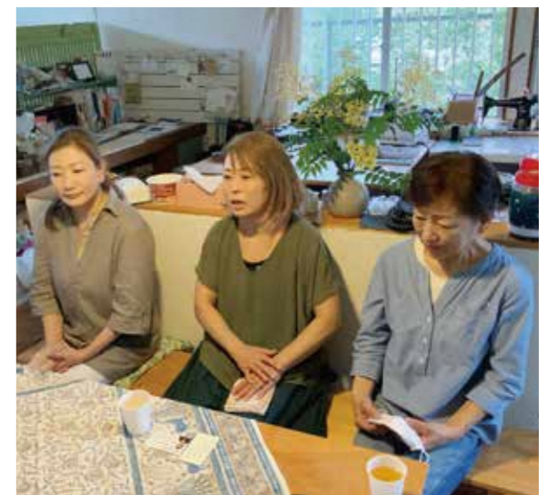
共に活動されている皆さん

昨年「にゃんたん市プロジェクト」が立ち上げられた中、身近な生き物との関わりを大切に、「共生」を考えながら市内で命を大切にする活動を進められている皆さんにお話をお聞きました。