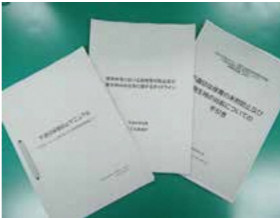
南丹市不適切保育防止マニュアル他

Q 全国の認可保育所で起きている暴行や虐待といった不適切な保育に伴う国の実態調査の結果は。 A 本市においては、「子どもを大声で叱った」として1件を報告。 Q 人権やコンプライアンス遵守などの職員研修はどのようになっているか。 A 外部の専門講師による各園巡回研修の実施。保育の質の向上や子どもの主体性を育む保育、子ども一人一人に寄り添う保育の実践を目指して保育のマニュアルを作成し、職員共有している。ま