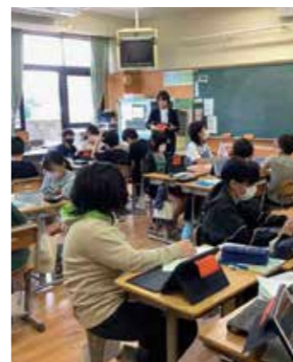
進められる児童ありきの教育