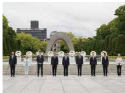
G7サミット

Q G7サミット主要国首脳会議が、広島で開催された。参加者は時間をかけて原爆資料館を見学して、原爆ドームで献花を行い、犠牲者のご冥福と平和を祈念された。この訪問は大きな意義があつたと思うが。 A 原爆慰霊碑にそれぞれ献花されたことで、平和の願いを世界に発信できた。また、原爆資料館の見学に時間をかけて行い、非常に悲惨な状況を目の当たりにして首脳にインパクトを与えた。原爆、核兵器を考えていく上で