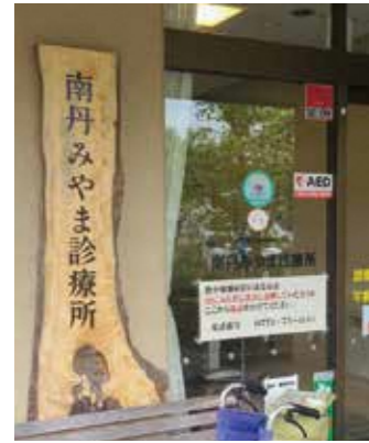
南丹市の医療の要、南丹みやま診療所