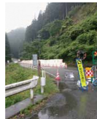
土砂崩れによる片側通行

Q 梅雨・台風の時期になったが、災害対策の現状と過去の災害を教訓とした防災対策は。 A 近年は、全国的に多くの地域で線状降水帯が発生し、集中豪雨が発生している。平成30年には、西日本豪雨を経験した。本市には、非常にたくさんの危険箇所があり、一気に対応することが非常に困難であるが、危険箇所のパトロールを行うとともに、府には砂防ダム、河川の改修・しゅんせつ等をお願いしている。