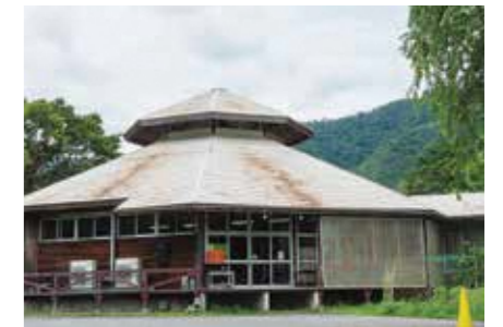
小学校のランチルーム

物価高騰により、小・中学生の保護者の負担を軽減するため、年間負担の3分の1相当額を対象保護者に支給するものです。支給額は1人当たり小学生1万5千円、中学生1万6千円。給食費の保護者負担金(1人1食当たり小学生260円、中学生300円)には、変更ありません。