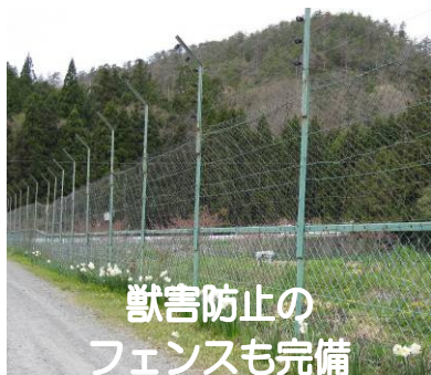
獣害防止のフェンスも完備