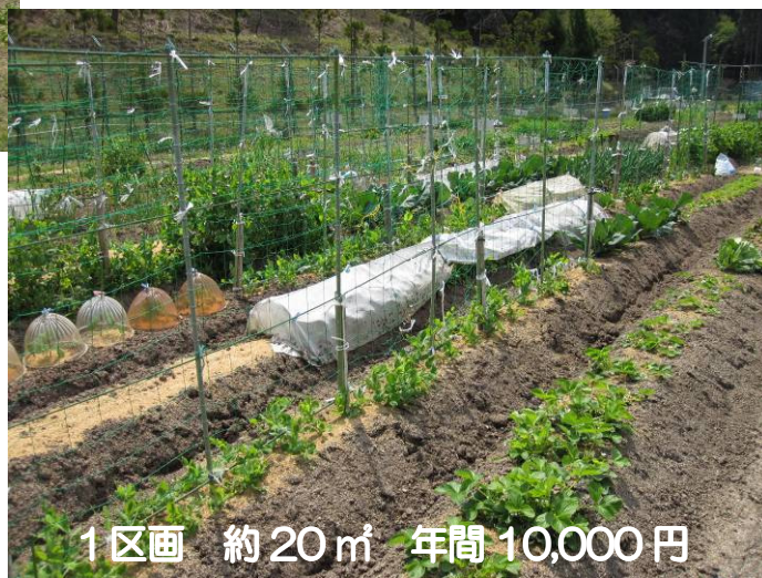
1区画 約20㎡ 年間10,000円