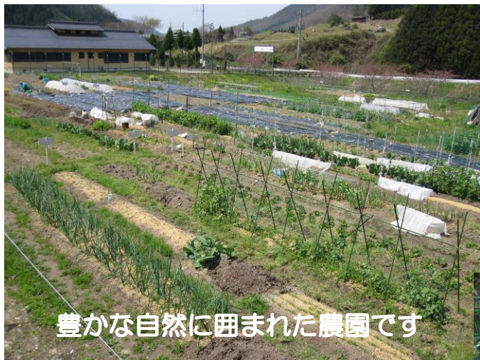
豊かな自然に囲まれた農園です