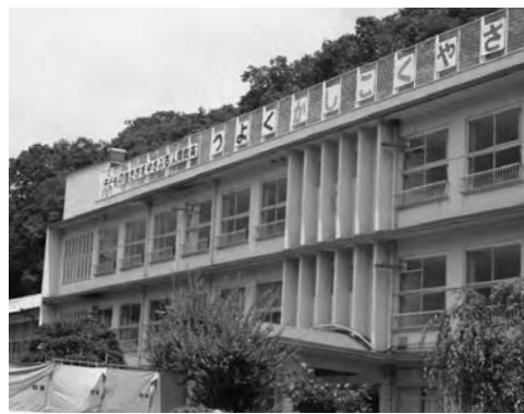
改築前の殿田小学校

九百八十平方メートルとなり、社会体育施設としての利用も可能になるほか、学童保育施設を併設しており、今後は放課後児童クラブも行えるようになります。