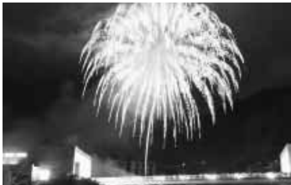
▲1,500発の花火が打ち上げられました

夕方からは、夜店が並び多くの人が集まりました。夜8時には恒例となった花火大会が行われ、訪れた観衆を魅了しました。