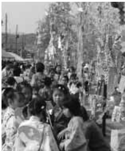
▲ズラリと並んだ七夕飾り

夏の風物詩となっている「そのべ七夕まつり」が宮町シンボルロードで行われました。今年で26回目となった祭りは園部町商工会青年部が市と旧3町の商工会関係者の協力を得て実施。朝から歩行者天国となったシンボルロードには七夕飾りが所狭しと並べられ祭りムードを盛り上げました。