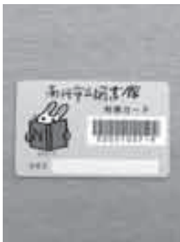
▲図書館利用者カード