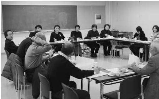
▲男女共同参画社会への思いを語る参加者

第2回となるキラリなんたんカフェを八木支所で開催。南丹市女性ネットワーク会議の役員、男性参加者などが「まち・むらで女と男が対等に協力できるためには」などのテーマで思いを語り合いました。