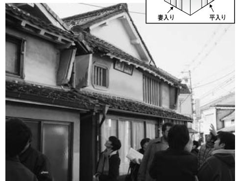
▲町並みを見て回る参加者