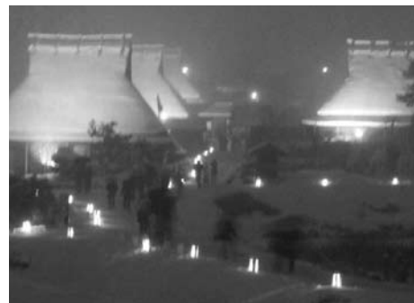
▲雪灯ろうと花灯ろうがともすかやぶき屋根

美山町北集落において、6回目となる「かやぶきの里雪灯廊」を同実行委員会が開催。今年は雪不足のため、集落一帯に木製の灯ろう（花灯ろう）を設置しましたが、最終日には待望の雪が降り、子どもたちがバケツで作った雪灯ろうに明かりが付き、雪化粧のかやぶき民家を幻想的にともしました。初日と最終日には花火が打ち上げられたほか、屋台で温かいおでんや豚汁などを販売。集落内はさまざまなアングルで写真を撮る観光客で溢れました。