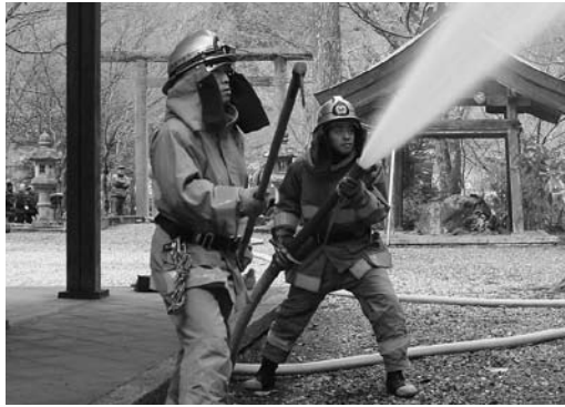
▲放水を行う園部消防署日吉出張所の隊員

武尾神社（園部町高屋）、住吉神社（八木町西田）、多治神社（日吉町田原）、道相神社（美山町宮脇）の市内4つの神社において文化財防火訓練が行われました。1月26日の文化財防火デーに合わせ園部消防署、教育委員会が主催し、消防団、各神社の保存会などが協力して実施したもので、31日に多治神社で行われた訓練にはおよそ70人が参加。園部消防署日吉出張所と消防団日吉支団第2分団の消防車が出動し、迅速な放水が行われました。