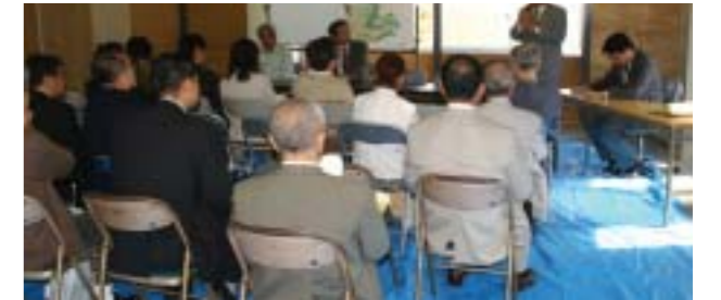
企業や住民への説明会を積極的に行っています