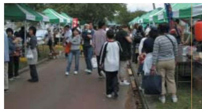
にこにこまつり(八木町)