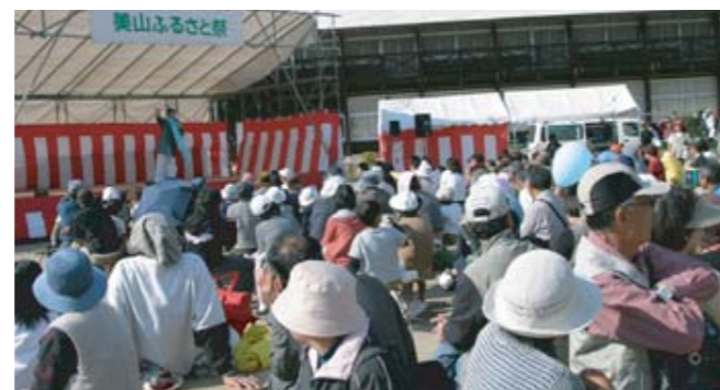
美山ふるさと祭(美山町)