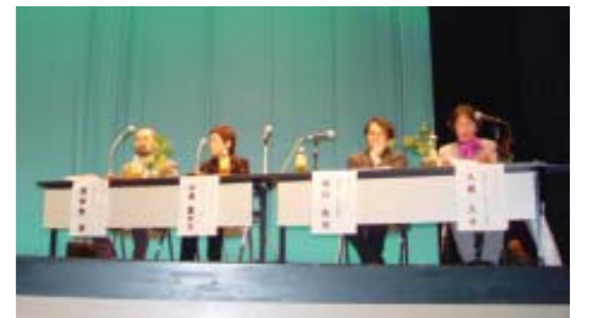
「美山の魅力と可能性」を探りあったフォーラム(美山文化ホール)