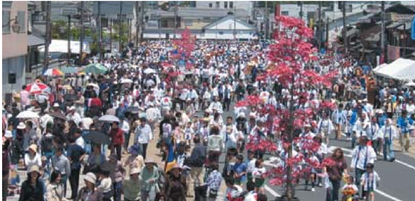
そのべ龍神まつり(園部町)

積極的な住民参加による協働のまちづくりが求められています。 南丹市では、情報公開の推進、住民によるコミュニティ活動・地域づくりの支援、住民の市政参画の充実、行政組織の効率化を図る一方、 人権を大切にする地域社会づくりをさらに推進していきます。