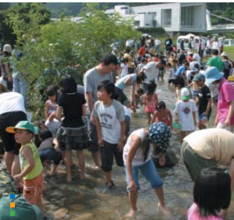
スプリングフェスタ(日吉町)