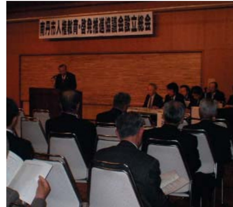
人権を大切にするまちづくりに向け発足した南丹市人権教育・啓発推進協議会