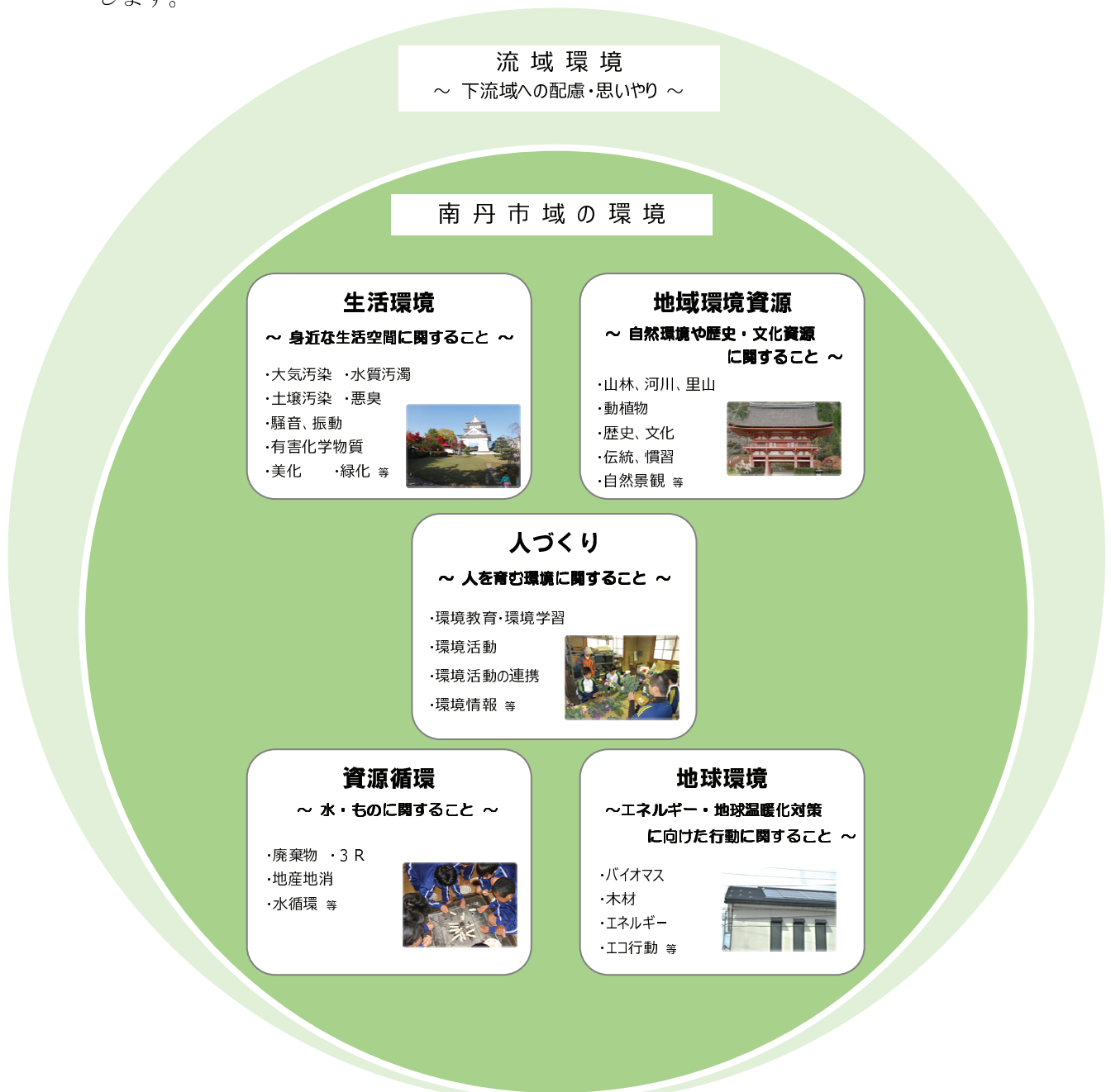
計画における環境のとらえ方

また、本市は由良川・桂川（淀川水系）の最上流地域に位置することから、市域に留まらず、特に下流域への意識など、広域的な環境についても施策などを設定することとします。