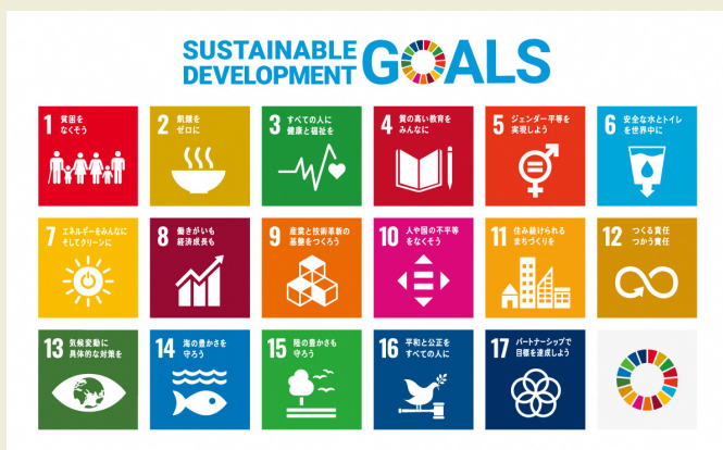
資料:国連広報センター「持続可能な開発目標(SDGs)」

SDGsとは、平成27年9月に国連サミットで採択された、持続可能な世界を実現するための17の目標と169のターゲットで構成される国際社会共通の目標のことです。