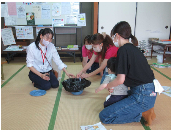
〈写真9〉 ほこぼクラブ・親子で学ぶ防災講座