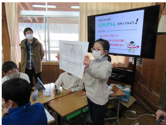
〈写真 15〉 美山小・福祉学習(ユニバーサルデザイン)

音訳ボランティアのサポートを通じて、市などの広報誌の録音物の作成・配布を支援しました。