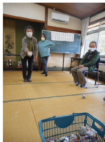
〈写真6〉 サロンすずらん “みんなでなんたんグランプリ”に挑戦中 （美山町）