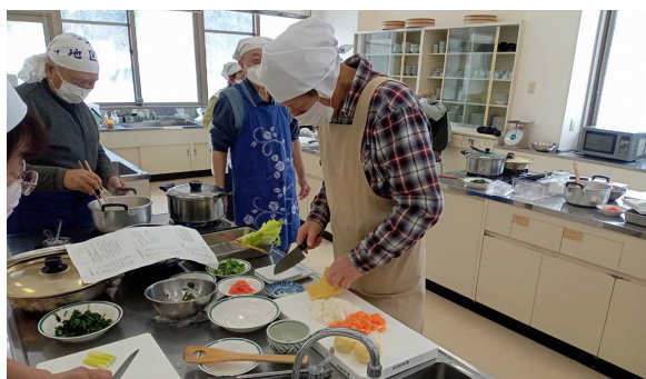
〈写真17〉 男性料理教室における調理指導ボランティア