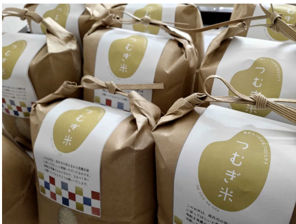
〈写真 14〉 食からつながるプロジェクト @なんたん〜つむぎ米〜