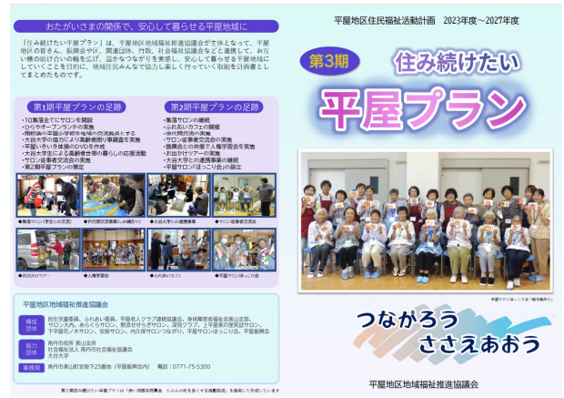
〈写真 13〉 平屋地区第3期住民福祉計画 （美山町）