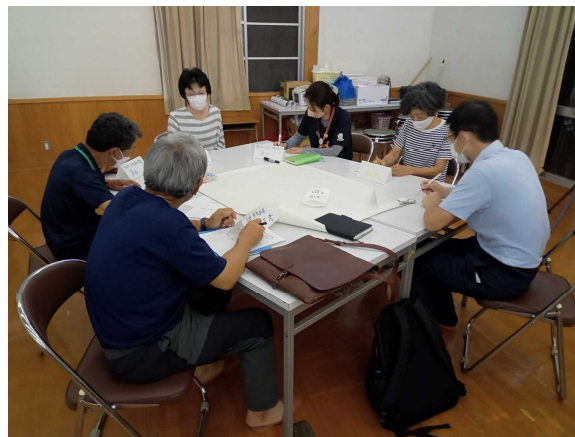
〈写真2〉 民生児童委員・ふれあい委員交流会 （美山町）