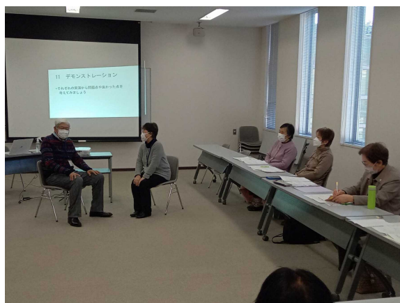
〈写真 16〉 傾聴ボランティア講座