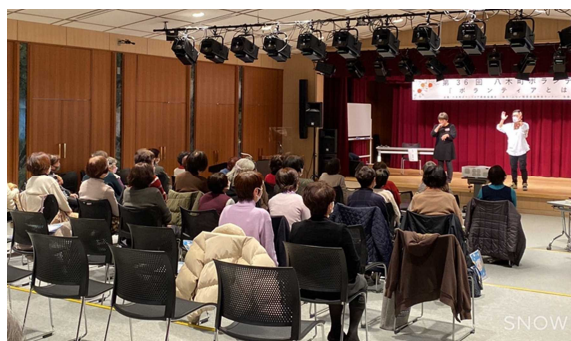
〈写真18〉 八木町ボランティア交流会