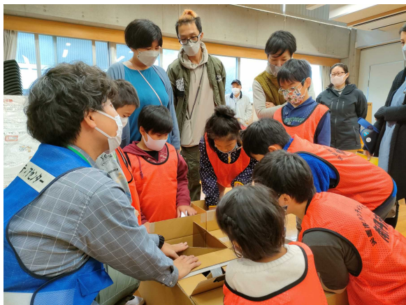
〈写真11〉 殿田小学校「まなぼうさい」