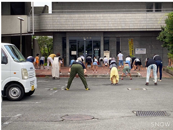
〈写真1〉 ふれあい事業（ラジオ体操） （八木町）