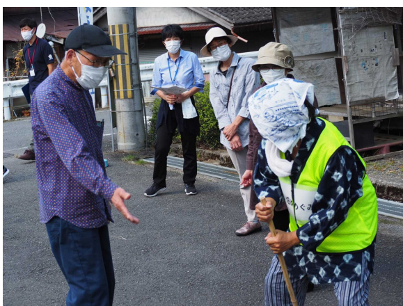
〈写真3〉 生畑見守り声かけ訓練 （日吉町）