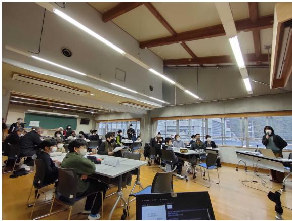
〈写真 12〉 日吉町たすけあい会議（殿田小にて）