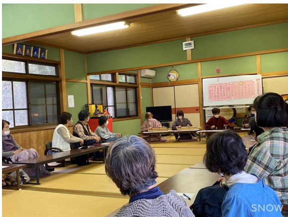
〈写真5〉 おしゃべりサロン嶋 （八木町）