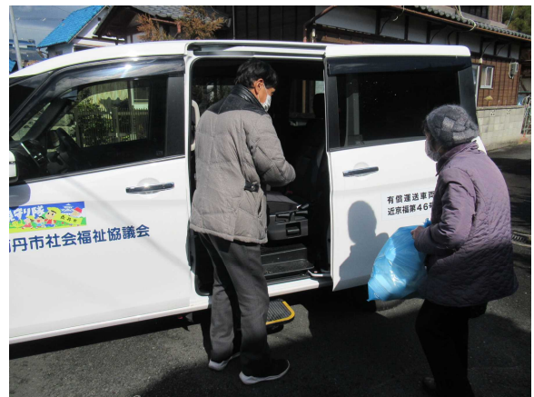
〈写真8〉 買い物支援実証実験事業 「買い物サポートそのへ」