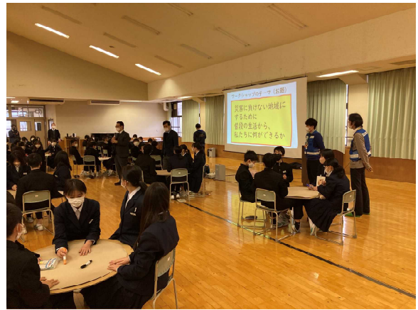
〈写真10〉 園部中学校・防災熟議