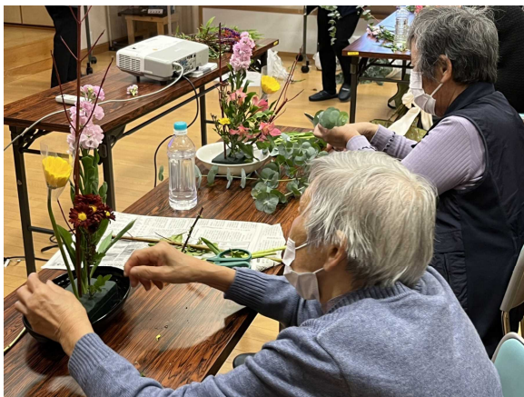
〈写真7〉 地域の通いの場 大野にここに会 （美山町）