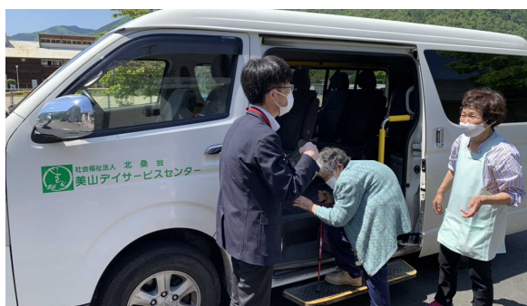
〈写真19〉 美山やすらぎホームによるサロン送迎