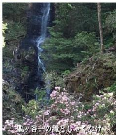
聖ヶ谷一の滝としゃくなげ