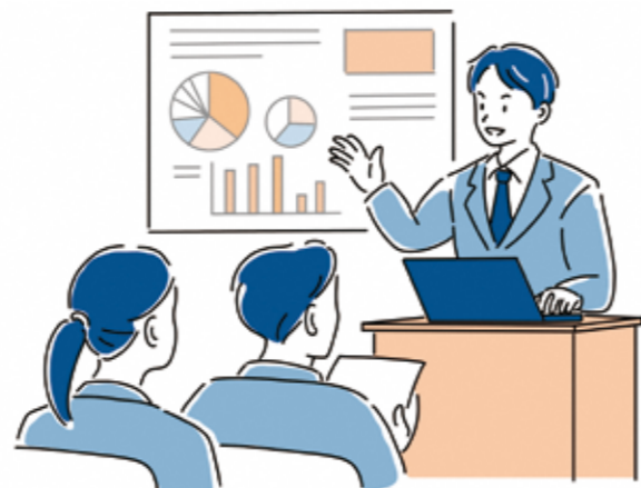
会計別予算額の状況

一般会計、特別会計及び公営企業会計を合わせた全会計の予算総額は372億6024万円で、対前年度比12.0%の減。このうち、一般会計は222億9500万円で、前年度に比べ49億1800万円、18.1%の減となっています。