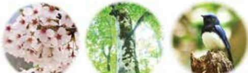
市の花 さくら 市の木 ふな 市の鳥 オオルリ

●総人口：28,947人(+36) (男：14,091人・女：14,856人) (+17) (+19) ●世帯数：14,344世帯(+75) (令和8年5月1日現在) ( )内は前月比