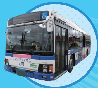
現運行会社 西日本ジェイアールバス [園福線]