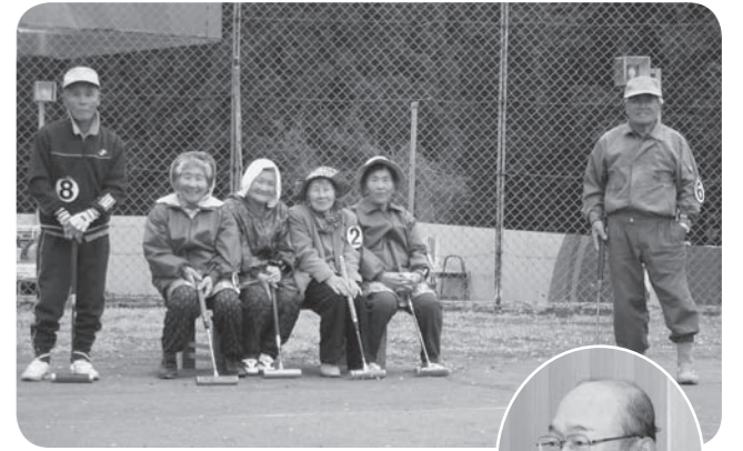
元気にゲートボールを楽しむ皆さん

市長 平成25年度までに、市内に145橋ある15m以上の橋梁の長寿化計画の策定を行う。市道・橋梁など中長期的な整備計画を進めていく必要があると認識している。