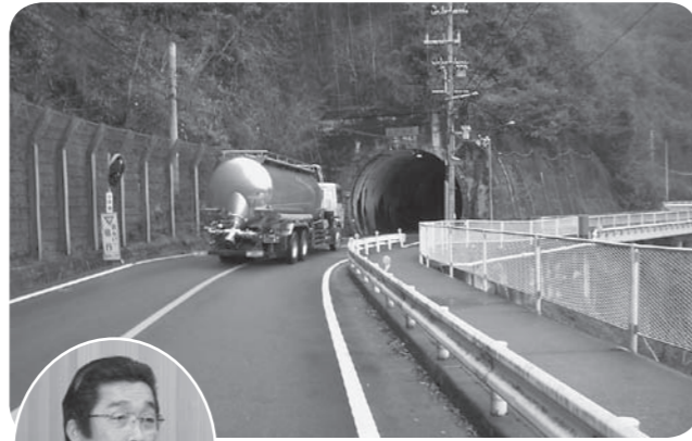
抜本改良が求められる大野トンネル付近

市長 道路完成後は本市が譲り受ける。移管後の維持管理に負担が伴わないよう事業実施中に十分な協議が必要である。今後も地元要望を聞き、地元と連携を図り、緑資源機構と協議していく。