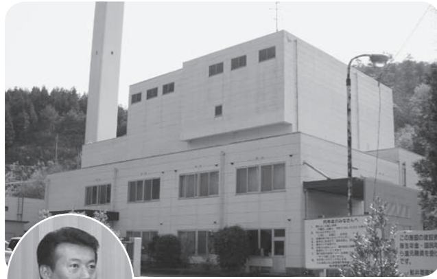
使われなくなった船井衛管焼却炉