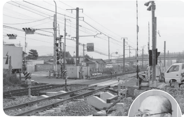
急がれるJR複線電化

問 公共交通網の整備は市民の利便性・一体感の醸成に大切な要素であり地域の実情・需要に応じたサービスが必要である。そのためには総合的視点・多角的視野に基づく議論が求められる。この視点に立ちバス会計の一元化を図り、全体的な公共交通体系を精査検討することが重要であると考え、市長の見解を伺う。高齢化の進行は交通過疎問題と正