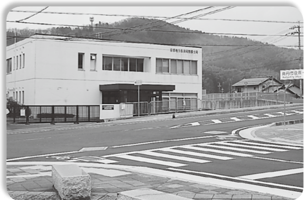
活用が待たれる旧法務局舎

問 八木駅舎改築の現状と市街化区域内の上下水道のインフラ整備が必要と考えるが。 市長 早期のバリアフリー化に向け、JRと協議する。良好な市街化形成のためライフライン整備に努力する。