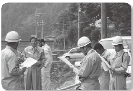
管内調査(日吉地内)

福島県田村市議会産業建設常任委員会の視察受け入れを行いました。 流域下水施設の移管について同様の課題を抱えていることから、活発な意見交換ができました。全国の課題を抱える市で協議会を結成する方向で意見を取りまとめることができ、有意義な視察受け入れになりました。