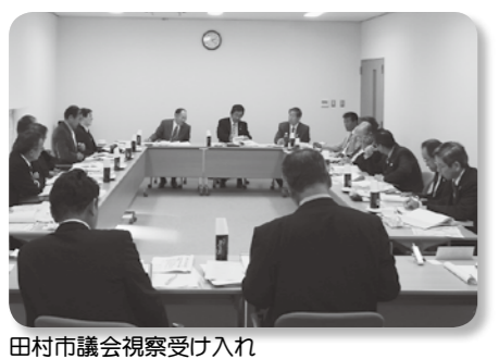
田村市議会視察受け入れ

議案第107号 南丹市一般会計補正予算(第1号)を審査。 賛成多数により可決。 議案第108号 南丹市一般会計補正予算(第1号)を審査。 賛成多数により可決。 議案第109号 南丹市一般会計補正予算(第1号)を審査。 賛成多数により可決。