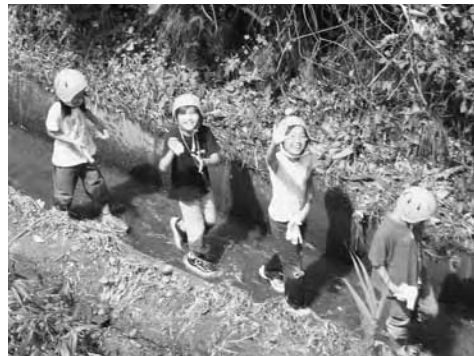
用水路を元気良く進む子どもたち

農業用の用水路など「水の路」をたどり、農業に欠くことのできない水との触れあいを通じて、里山や水田が育む豊かな自然を体験する『ふるさと発見隊』(南丹広域振興局主催)に南丹市内の小学生28人が参加しました。参加者は、美山町内久保地内にある1.3 キロ の用水路を探検。途中のトンネルでは、懐中電灯で辺りを照らしながら進んで行き、用水路のゴールとなった田んぼにたどり着きました。