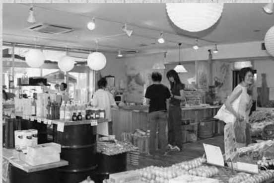
美山の商品が並び、にぎわう「ふらつと美山」店内

ここは、平成十七年八月十日に、京都府で十二番目の「道の駅」に登録されました。地域の特産品や新鮮野菜が販売されている「ふらつと美山」をはじめ、かやぶきの里など美山の観光マップなどを配布する観光案内所（美山町観光協会）、休憩所となるあずまや、トイレ、駐車場があり、美山