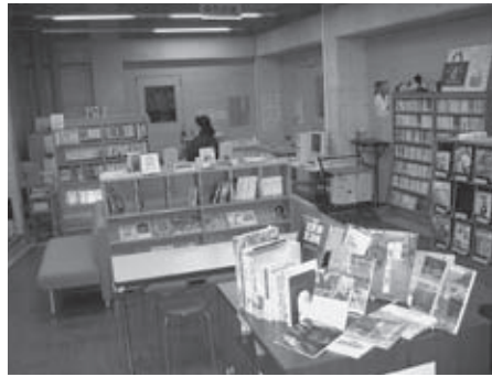
▲美山関連の本を集めたコーナー

※この作品は、今年の8月に募集した「なびっと4こまマンガ」の中から掲載しています。