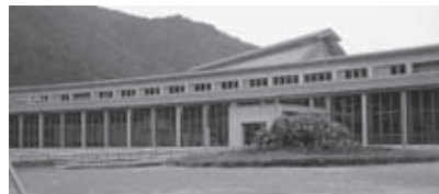
▲図書室のある美山文化ホール

この時期、紅葉を見に美山を訪れる観光客も多く、美山文化ホールにある図書室へも立ち寄られることがありま