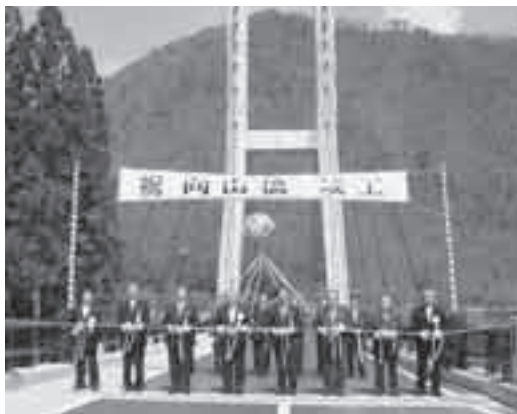
▲橋のしゅん工を祝いテープカットする市長ら

この橋は、昭和34年に架けられた旧向山橋の老朽化に伴い架け替えたもので、京都府の代行事業として総事業費13億円、5年の歳月をかけて実施しました。橋は全長200メートルの片側一車線道路で、塔から斜めに張ったケーブルで橋をつる斜張橋になっています。向山橋の完成により、快適な通行が実現しました。