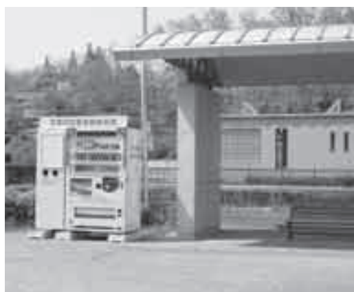
▲JR 鍼灸大学前駅に設置した災害対応型自動販売機

点にある在庫飲料の無償提供と、災害時に災害対応型自動販売機の飲料の無償提供などについて協定を結んだものです。