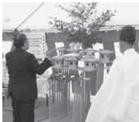
▲新工場建設工場の安全を願いました