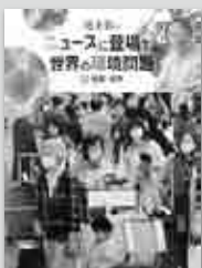
『池上彰のニュースに登場する世界の環境問題』 全5巻 さえら書房