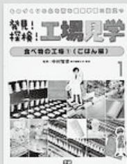
『発見!探検!工場見学』 全7巻 学習研究社