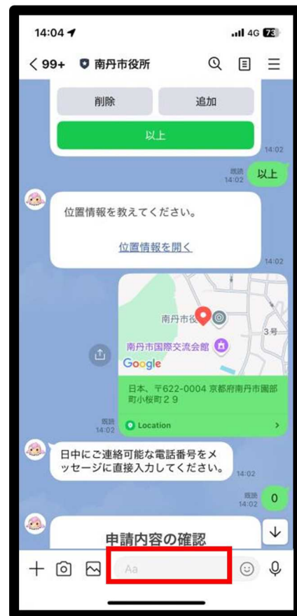
電話番号を入力します