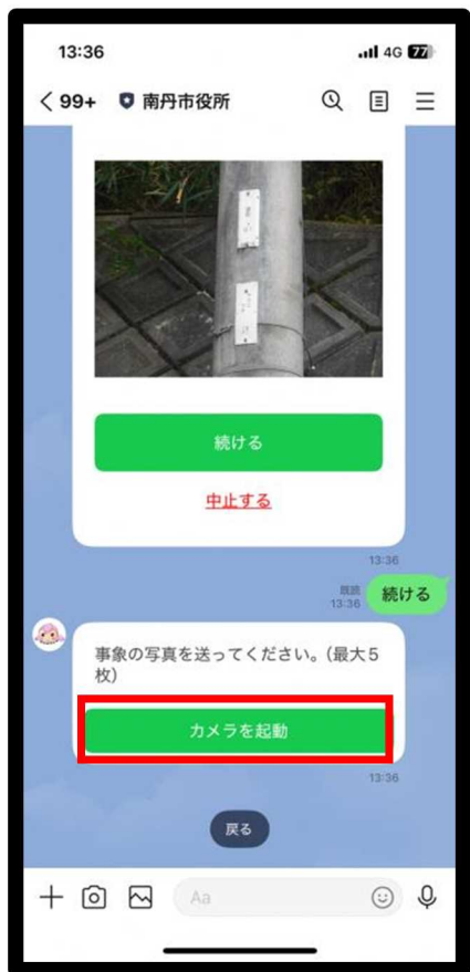
写真を撮影し送信します (すでに撮影した写真も 選択可能)