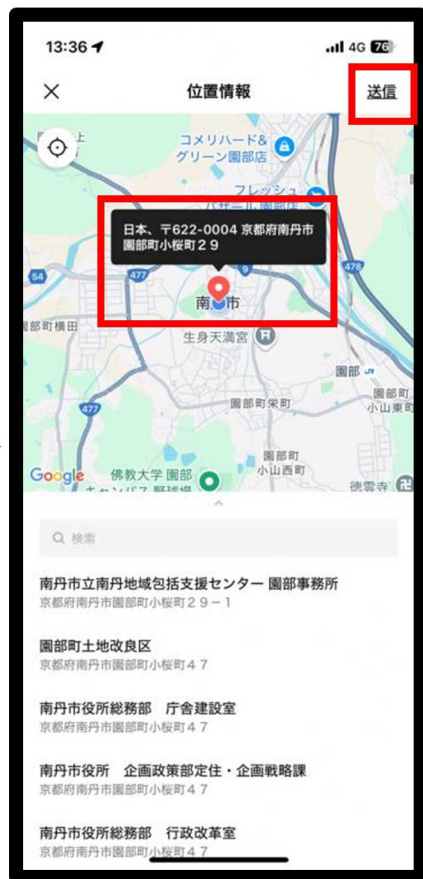
位置情報を送信します (LINE の設定で位置情報オンの場合 は現在地が表示されます)