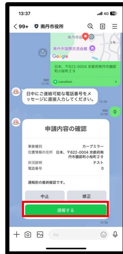
「通報する」を選択すると 情報が市役所に届きます