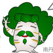
南丹市キャラクター ぶーなん