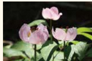
5 月 24 日 ベニバナヤマジャクヤクを 鑑賞する 京都駅発着バスツアー