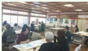
観光アイデア交流会

また、ラーニングツーリズムの推進の一環として、視察研修や教育旅行プログラムの紹介ページを新たに作成しました。今後、地域の皆様とともに美山の魅力を来訪者へお届けしてまいります。