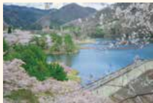
4 月 4 日 大野ダムさくら祭りを訪ねる 京都駅発着バスツアー