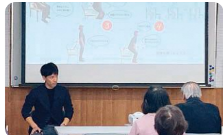
西岡先生による講演