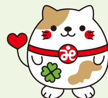
南丹市社協マスコット 「ニャンたん」

赤い羽根共同募金／歳末たすけあい募金にご協力いただきありがとうございました。 皆さまからお寄せいただいた募金は、南丹市内の人々を支える様々な福祉活動に役立てられます。