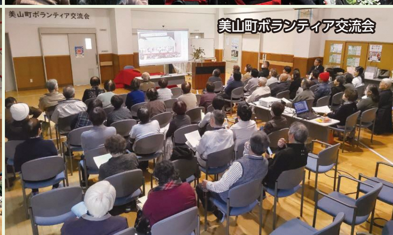
美山町ボランティア交流会