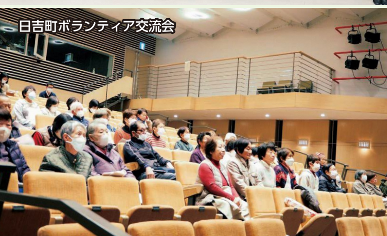
日吉町ボランティア交流会