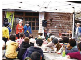
▲ワカチアイ(事業立上支援助成)