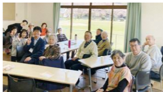
▲小山西町ふれあいいきいきサロン(ふれあいいきいきサロン活動助成)