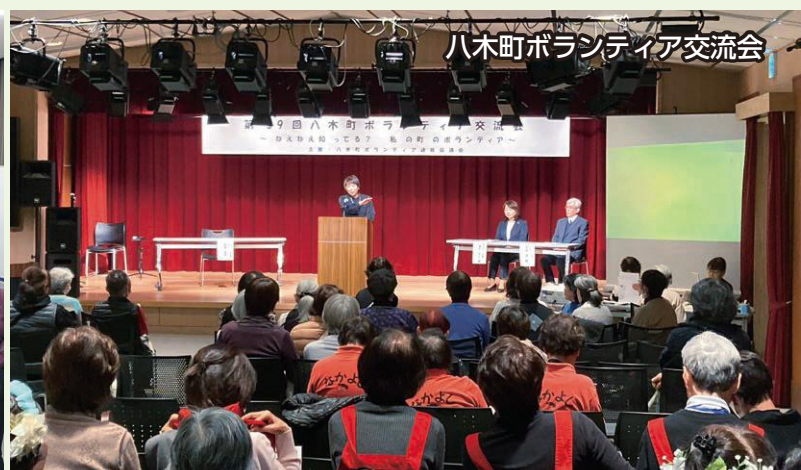
八木町ボランティア交流会