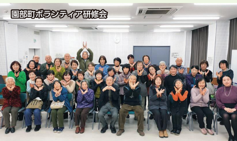
園部町ボランティア研修会