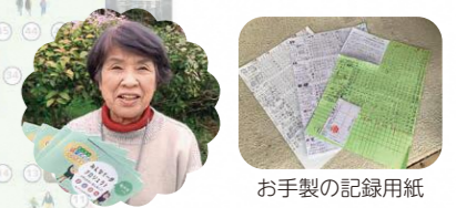
お手製の記録用紙