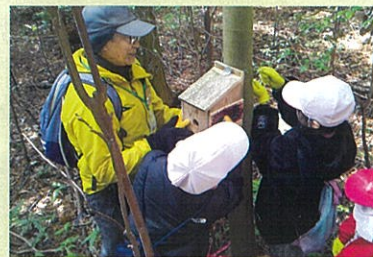
森の出前授業による環境学習

皆さんからいただいた「緑の募金」は、地球温暖化や災害防止、水源の涵養、生物多様性の保全などを目指した森林づくりや緑化運動、未来を担う子ども達の「緑の少年団」活動、学校緑化や森林環境教育、緑を大切にする心を育てるポスターコンクールの開催などのために使われています。