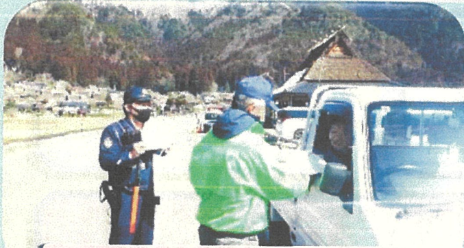
かやぶきの里で啓発活動を開催(3月)