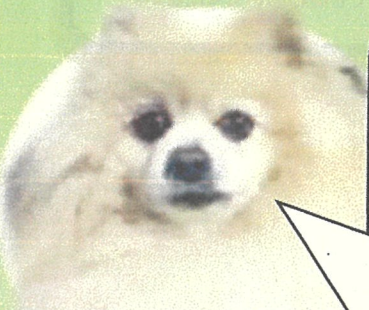
駐在所マスコット犬 小鉄

前々回掲載したとおり、妻の闘いは終わりを迎えたはずでしたが、私や愛犬たちが平穏な日常を謳歌していたある日、仕事を終えて居間に向かうと、妻の頭には、あの“睡眠学習”で多用していたヘッドホンが装着されていました。