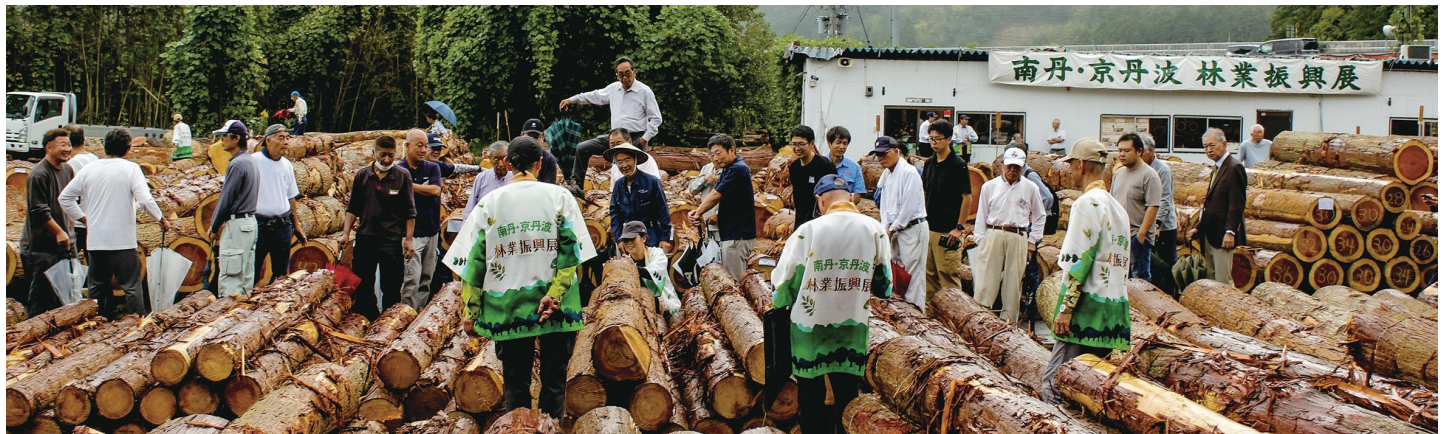
南丹・京丹波林業振興展「木材展示記念市（八木原木市場）」