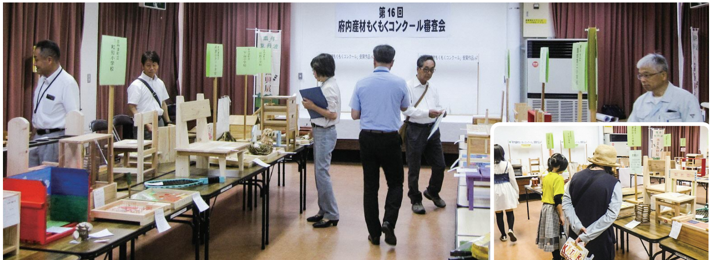
南丹・京丹波林業振興展 「府内産材もくもくコンクール」