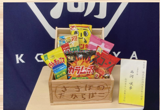
<特別賞:湖池屋京都工場賞(小学校の部)>

審査会には、湖池屋京都工場の担当者にも参画いただくとともに、特別賞の提供という形でも協力をいただきました。「もくもくコンクール」を通じて、地域に根ざした企業の自然環境への思いと、未来を担う子どもたちの創造力が結びつき、木作品という形で地域の木の魅力や森とのつながりが豊かに表現されました。