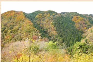
山奥まで植林された様子

第二次世界大戦により、木材資源として森林が大量に伐採され、森林の荒廃が進み、本来有する国土保全機能が著しく損なわれました。